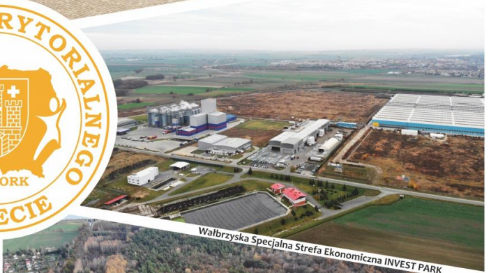
Wałbrzyska Specjalna Strefa Ekonomiczna INVEST PARK